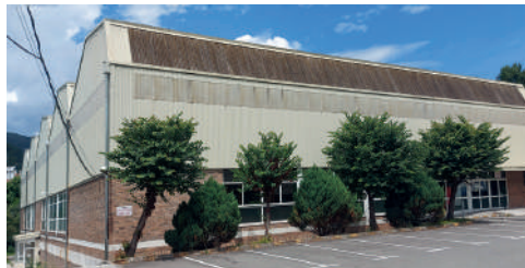
Polideportivo O CONSELLO