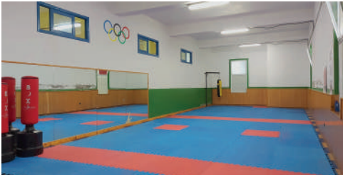
Polideportivo O Concello: SALA 2 TATAMI