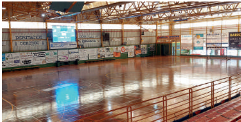
Polideportivo O CONSELLO: PISTA CENTRAL