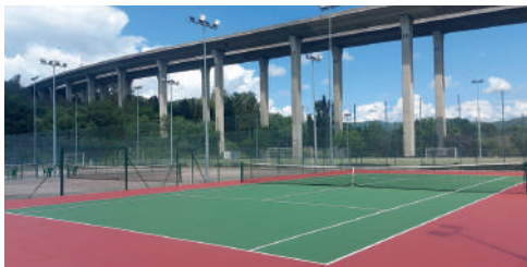
Complexo O Xestal: PISTAS DE TENIS