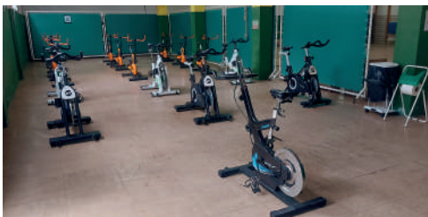
Polideportivo O Concello: SALA SPINNING