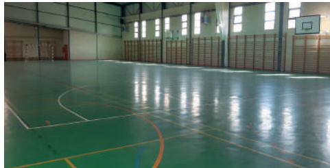
PAVILLÓN MUNICIPAL MAQUIÁNS