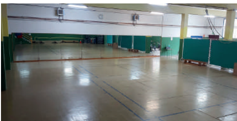
Polideportivo O Concello: SALA 1

Consello Municipal de Deportes de Ribadavia