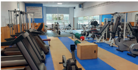
Polideportivo O Concello: SALA MUSCULACIÓN