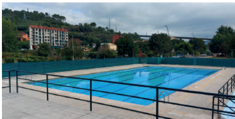
PISCINA MUNICIPAL A VERONZA