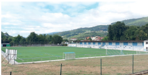
Complexo O Xestal: NOVO SINTÉTICO